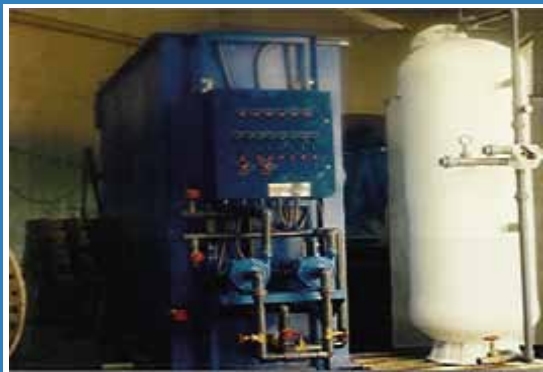
PLANTAS COMPACTAS AGUA POTABLE