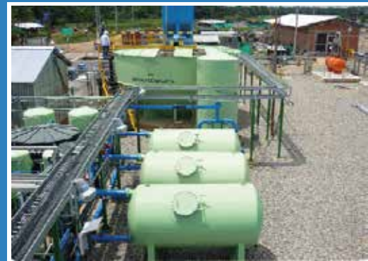
PLANTAS DE TRATAMIENTO DE AGUA INDUSTRIAL Y POTABLE