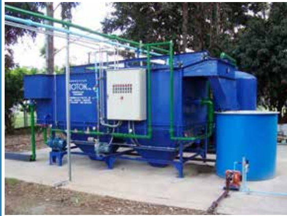
CELIDAS DE FLOTACIÓN