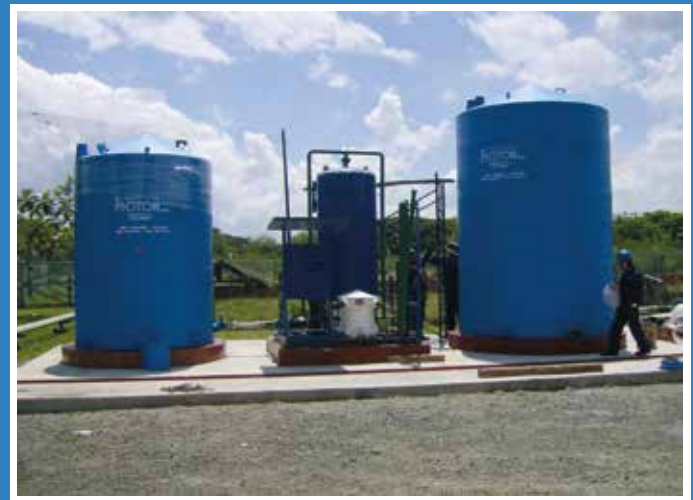
TANQUE PRFV ALMACENAMIENTO DE AGUA QUIMPAC - CALI

INGENIERÍA, DISEÑO Y FABRICACIÓN DE MAQUINARIA