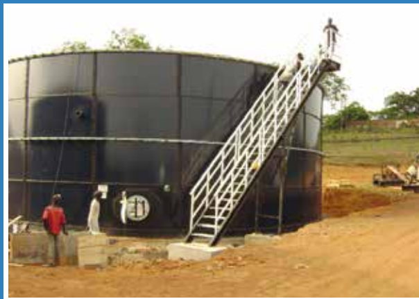
TANQUES DE ACERO VITRIFICADO ENSAMBLADOS POR TORNILLOS