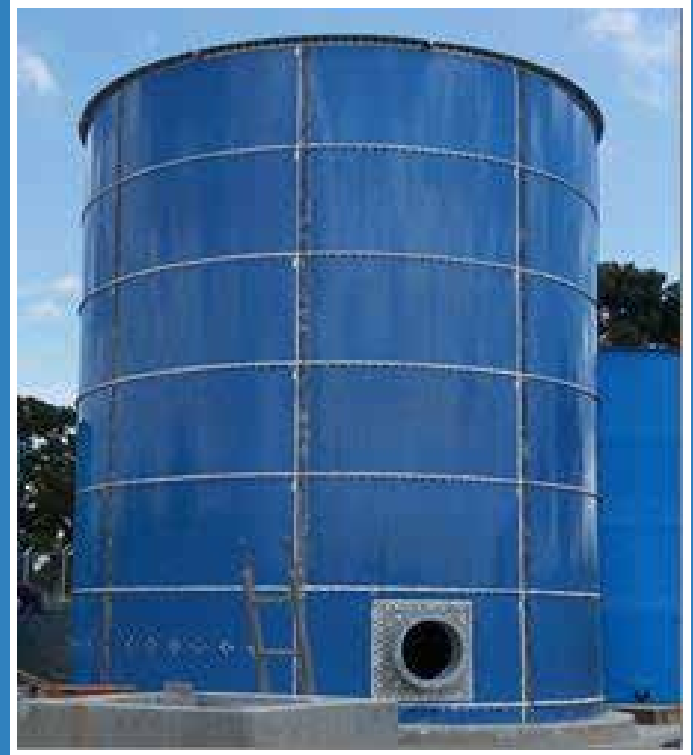
TANQUE AC. VITRIFICADO PERNADO COLOMBINA - TULUA