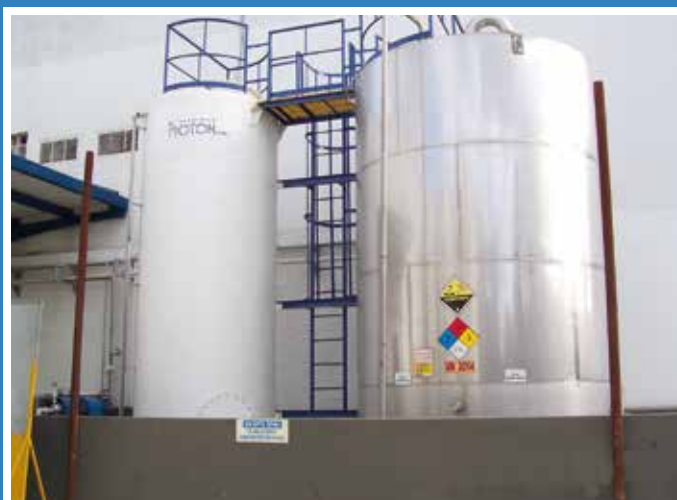
TANQUE PRFV AGUA DESMINERALIZADA TANQUE ACERO INOX. 316 PEROXIDO DE HIDROGENO CLOROX - BOGOTA