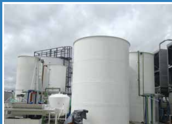
TANQUES DE PRFV DIFERENTES TAMAÑOS FRESENIUS MEDICAL CARE - SIBERIA