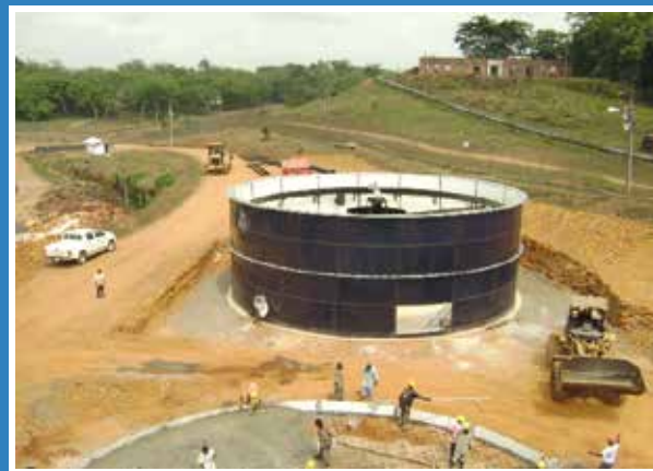
TANQUES DE ACERO VITRIFICADO ENSAMBLADOS POR TORNILLOS