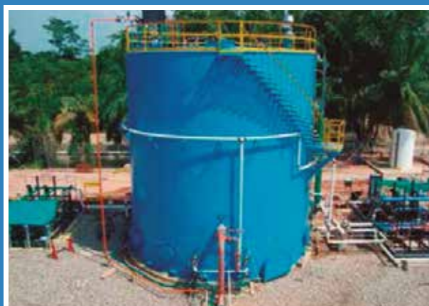
TANQUE DESNATADOR MULTICAMARA (SKIMMER TANK) PARA AGUAS DE PRODUCCION DE PETROLEO CASABE 5 - YONDO