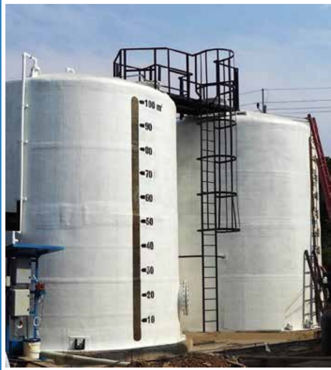
TANQUE PRFV ALMACENAMIENTO DE AGUA POTABLE TECNOFAR - VILLARICA